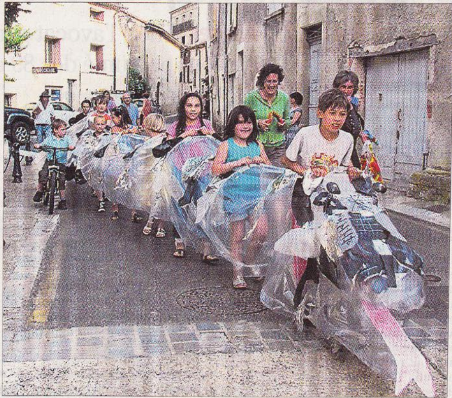
■ Les enfants ont promené samedi soir le serpent géant qu'ils ont réalisé en atelier.